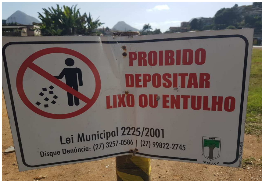
Modelo Placa - Item 02